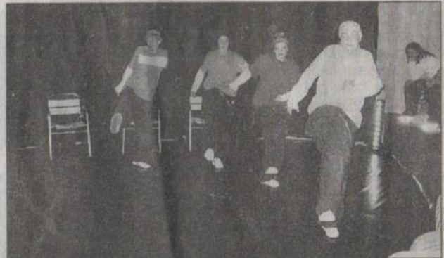
Un immense hommage à Charlot et à ses Temps modernes

Du grand art qui s'est laissé regarder avec exaltation et beaucoup d'amusement aussi.